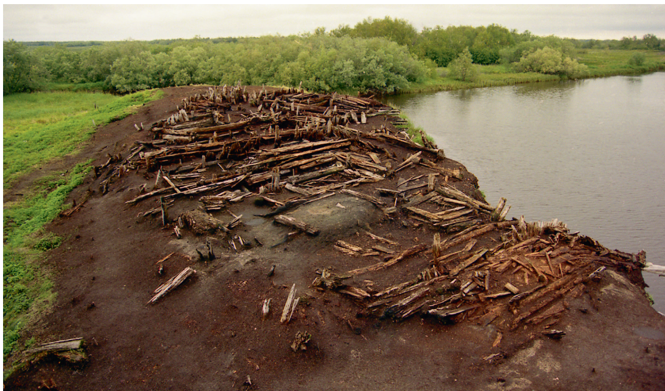
Рис. 3. Надымский городок. Остатки оборонительно-жилого комплекса XVI-XVIII вв. в мерзлом культурном слое. Материалы раскопок