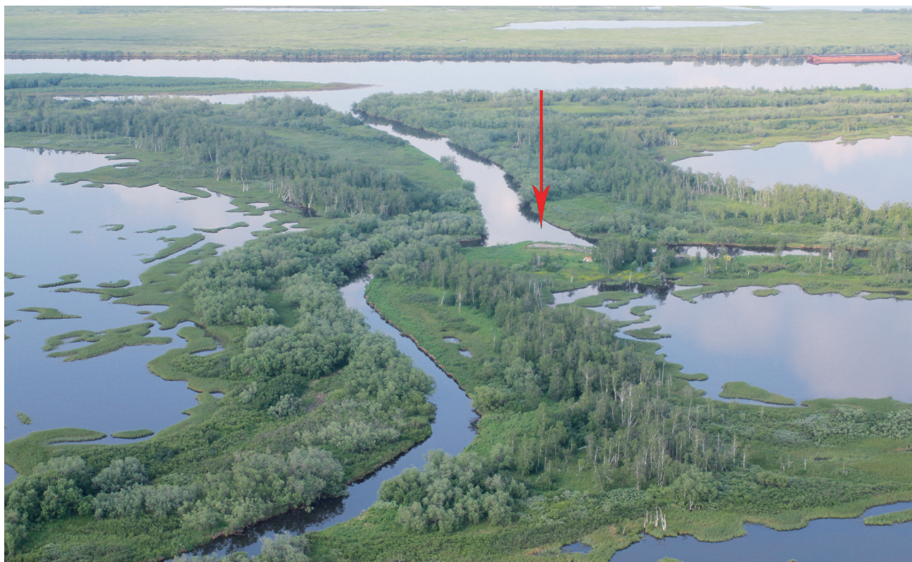
Рис. 2. Надымский городок. Общий вид с запада, 2013 г.