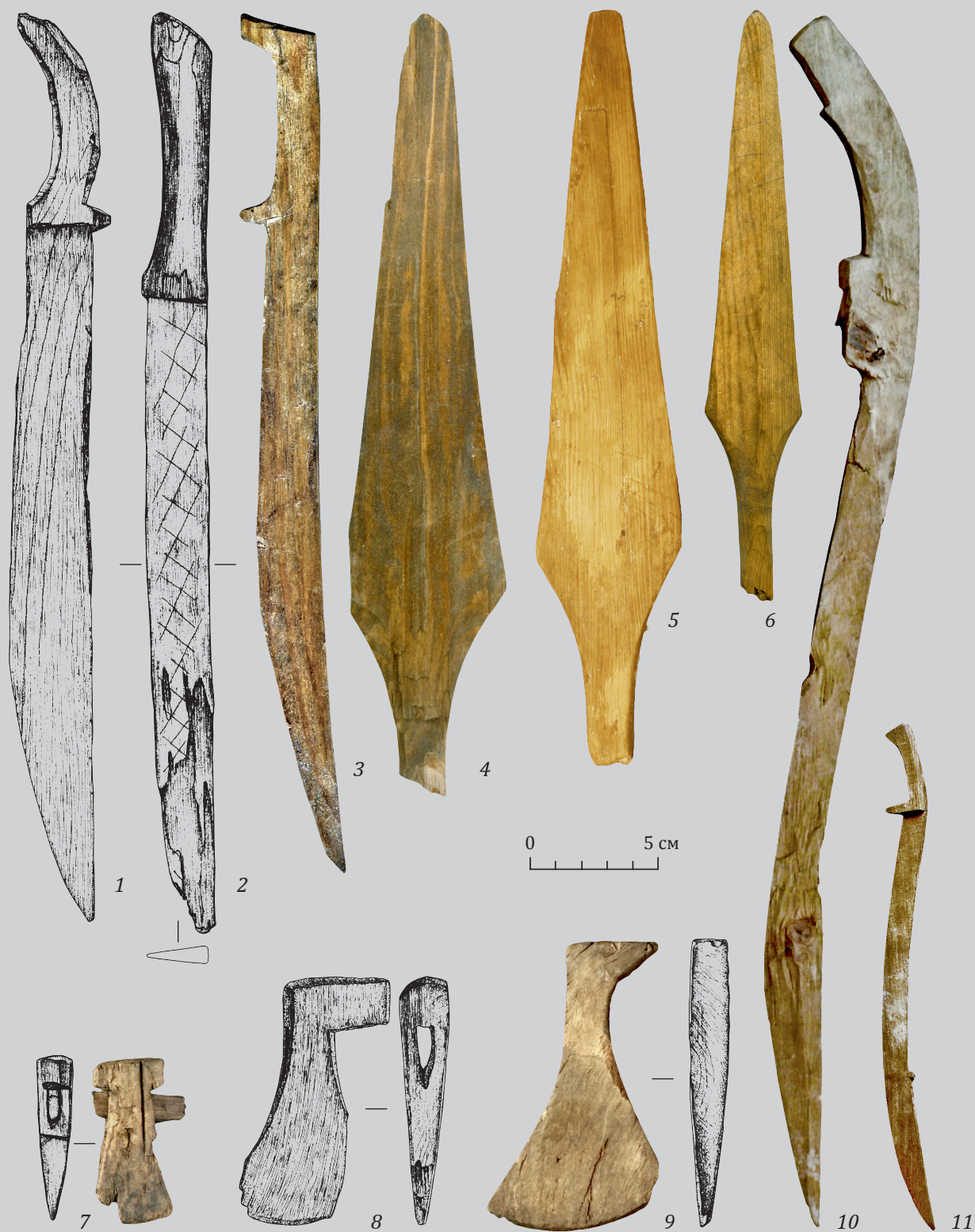
Рис. 5. Надымский городок. Модели предметов вооружения из дерева XVI – XVIII вв.: 1-3 – палаши, 4-6 – копья, 7-9 – боевые топоры, 10-11 – сабли