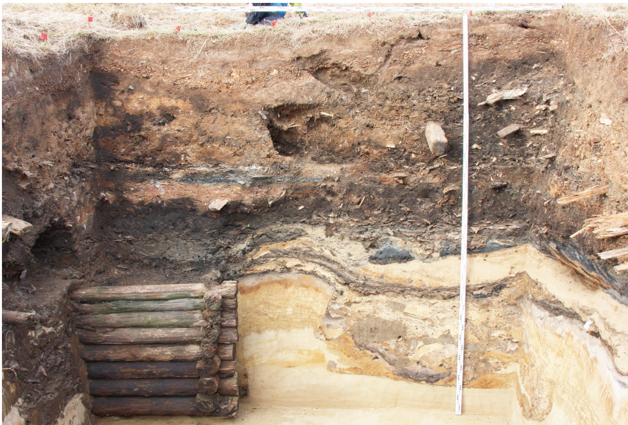
Рис. 7. Пустозерское городище. Остатки строений XVI–XVIII вв. в мерзлом культурном слое. Материалы раскопок 2011 г.