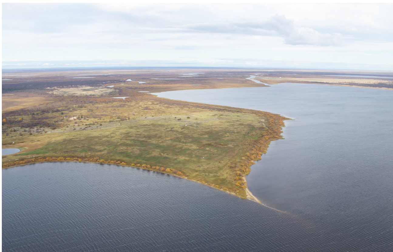
Рис. 6. Пустозерское городище. Общий вид с юго-запада, 2012 г.

действия иностранцев власти пытались пресечь, но контрабандная торговля с иностранцами продолжалась и в XVIII в. 8 Ее основой была торговля мехами. Причем считаем достаточно очевидным, что значительная часть этих мехов была продуктом промысловой деятельности аборигенов не только европейских, но и сибирских.